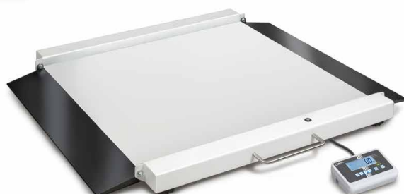
KERN MWA 300K-1M