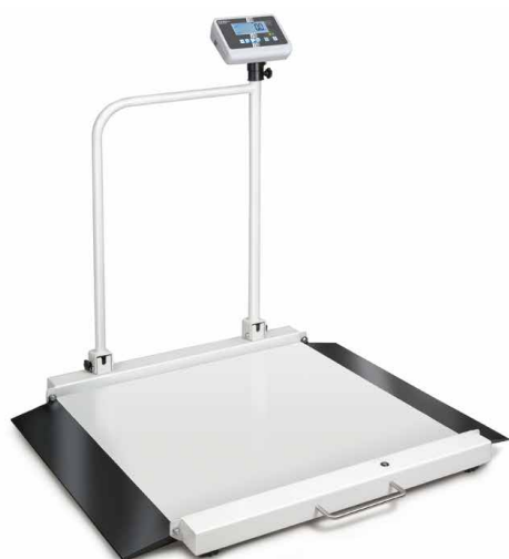
KERN MWA 300K-1PM

Bilancia per sedie a rotelle con due rampe integrate per una comoda salita – con autorizzazione all'uso medico, per l'uso professionale nella diagnostica medica, omologazione opzionale